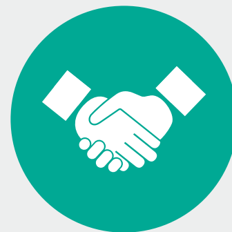
TOE FAAGAIOI/ TOE FAAFOISIA LE MALOSI