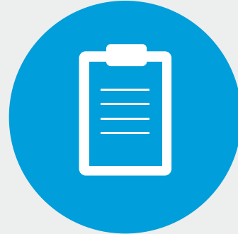
ILOILOGA KI FAKAMATAKUGA

Te vaega tenei mai tua e fakaasi, i te levolo maluga, te loto malie ki faifaiga sili i te ‘lei mo te puipuiga, talavaiga, pela foki te tausiga o ‘palaaga i tino e pokotia ne SCI. Te fakailoaga o maliega tasi ne fakatokagina ne te Expert Panel, kae fesoasoani kiei a mea fai galuega e fakamau i te fakaotiga o te tusitusiga taaua tenei.